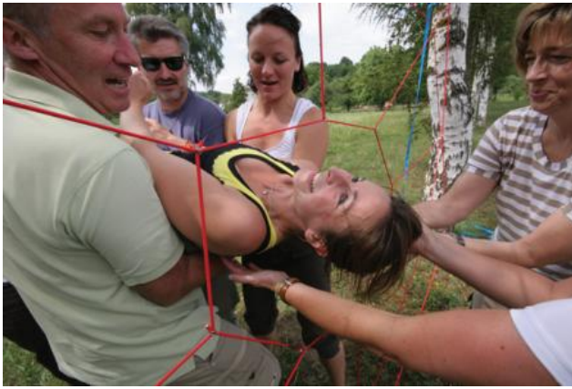
Campo de tensiones: Apoyo recíproco - Dinámica grupal Araña Fácil