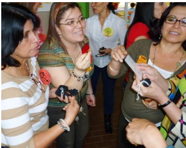
Campo de tensiones: Transparencia y Confiabilidad – Dinámica grupal Mercado de corazones