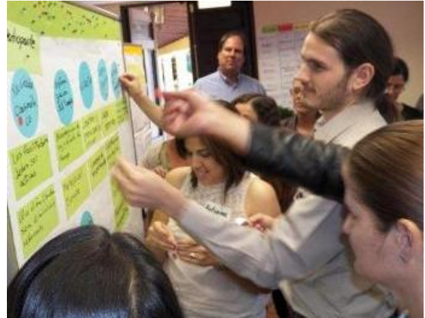
Interacción dialógica para crear nuevas rutinas