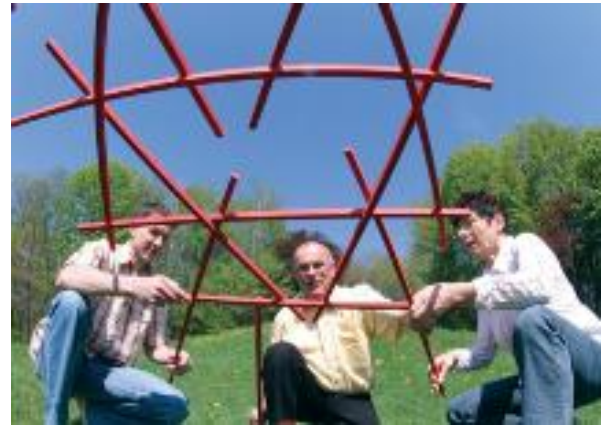
Campo de tensiones: Cultura de oposición - Dinámica grupal: El Puente de Leonardo