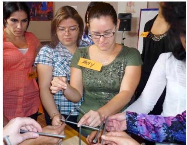
Campo de tension: Apoyo recíproco - Dinámica grupal Los clavos mágicos