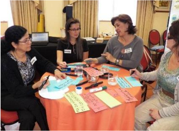
Espacios para escucha activa y cambio de perspectiva