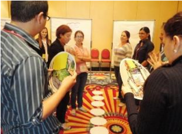
Campo de tensiones: Apoyo reciproco / Dinámica grupal Reality Check