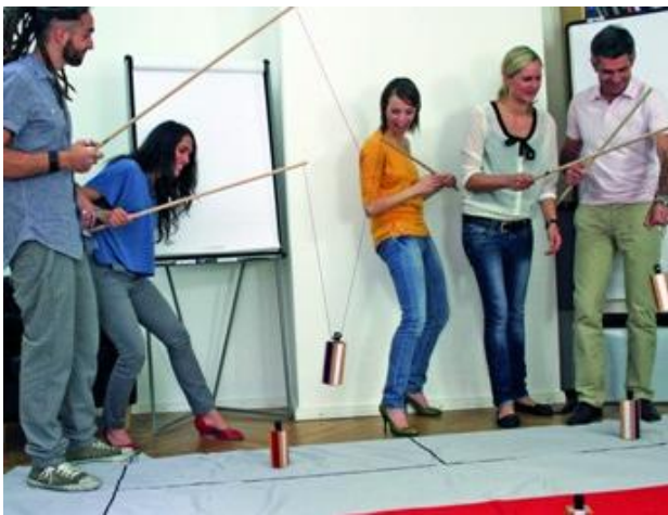
Campo de tensiones: Delimitación de funciones Dinámica grupal Catch Me!