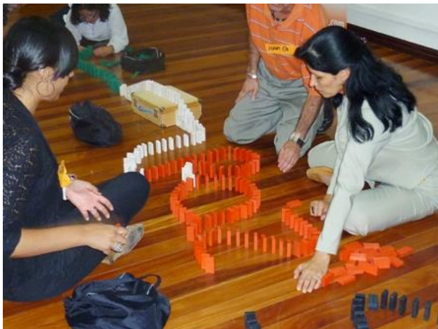
Campo de tensiones: División de Trabajo - Dinámica grupal Reacción en cadena