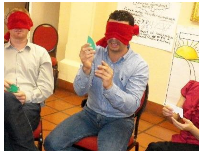
Campo de tensiones – Arquitectura de Innovación Dinámica grupal El arte de la comunicación