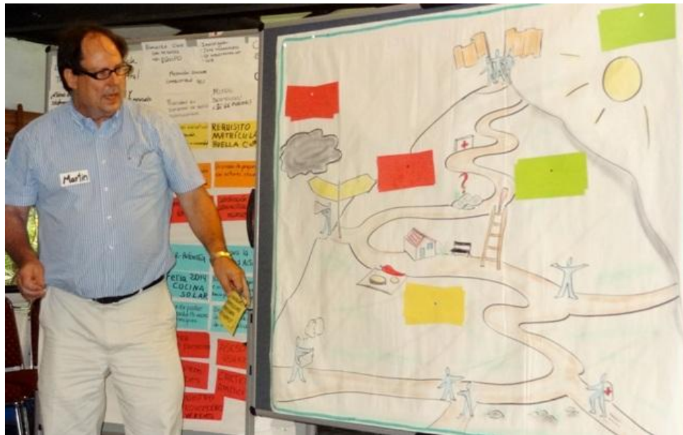
La vida laboral se presenta cada día con nuevos desafíos. ¿Con qué puedo contar y con quién cooperar?