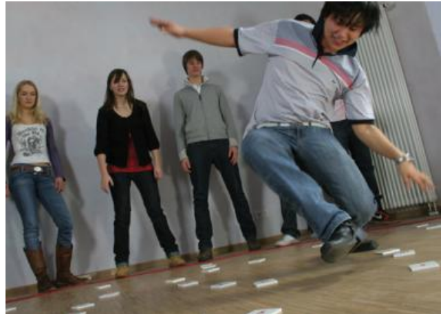
Campo de tensiones: Evaluación de experiencias – Dinámica grupal Complejidad