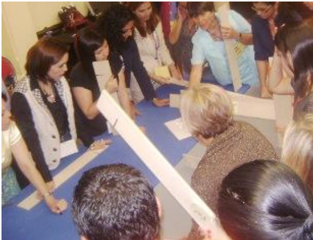
Campo de tensiones: División de trabajo - Dinámica grupal HeckMeck