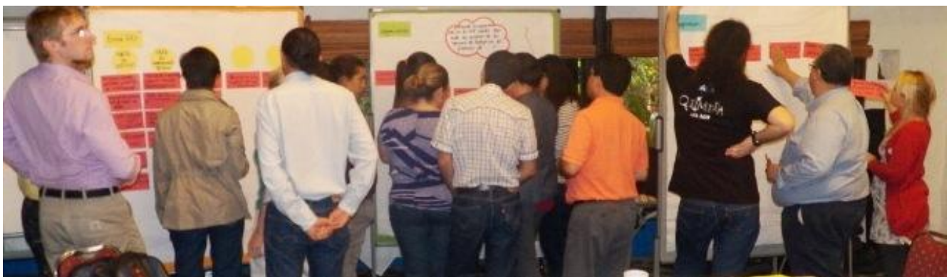
Trabajando paralelamente desde diferentes perspectivas para alcanzar una meta: Organización y Aprendizaje.